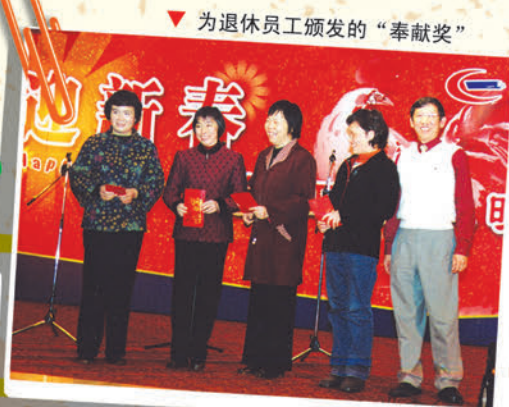
▼ 为退休员工颁发的“奉献奖”