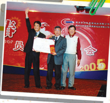
▲ 2004年度优秀品管圈奖