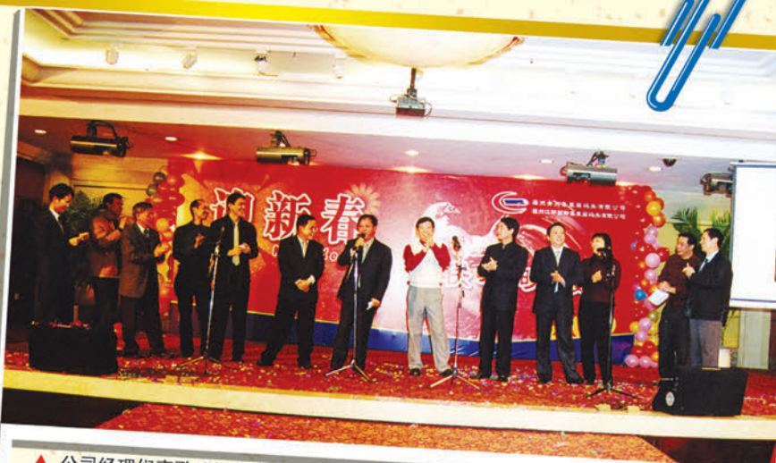
▲ 公司经理们高歌“祝福你”

当然每年的春晚都有一个相同的主题，那就是抽奖，今年的奖项比往年增加了凝聚奖（按桌抽，中奖的全桌人员都有奖品），从凝聚奖开始一直到特等奖，遍地开花，直到晚会结束，每个奖项都有了幸运的归属者。值得一提的是今年的抽奖形式也一改以往由公司领导上台抽奖为由电脑抽奖的形式，这样既增加了刺激感又加强了准确度，还提高了效率。