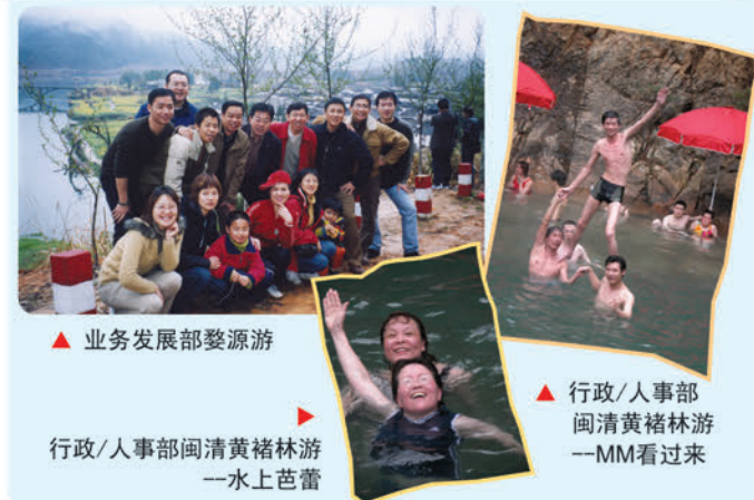
▲ 业务发展部婺源游