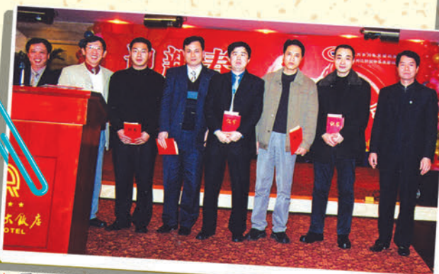
▲ 受福州港务集团表彰的优秀员工